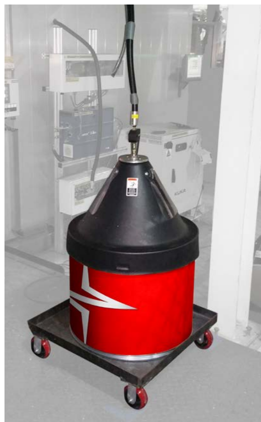
200 kg Fass mit Drahtfördersystem