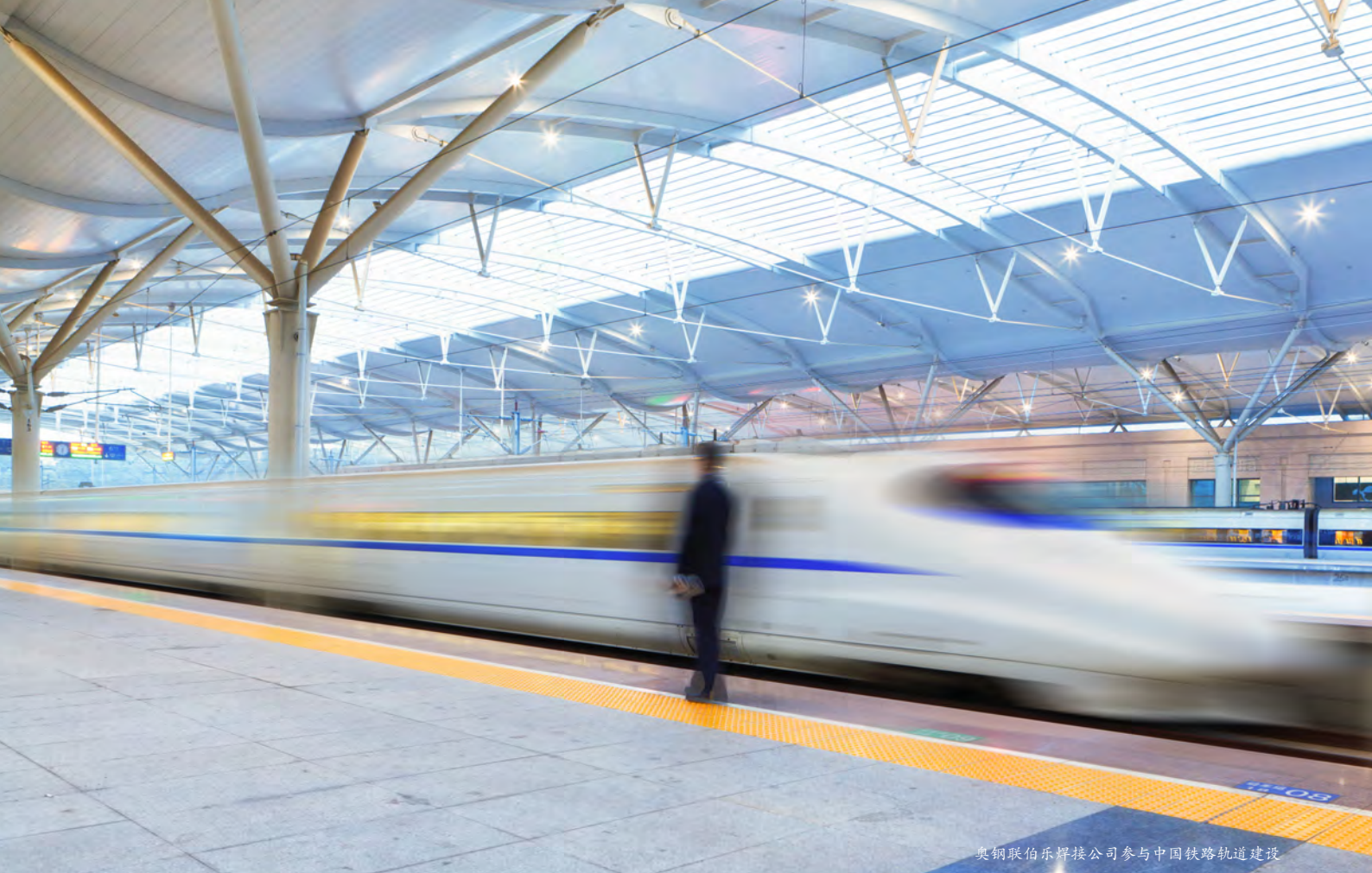
奥钢联伯乐焊接公司参与中国铁路轨道建设