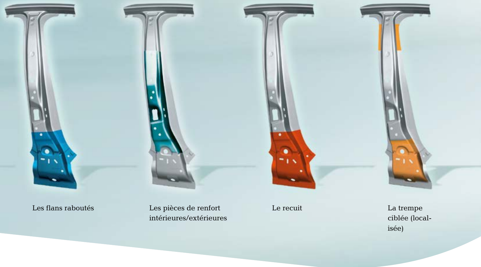
Les flans raboutés