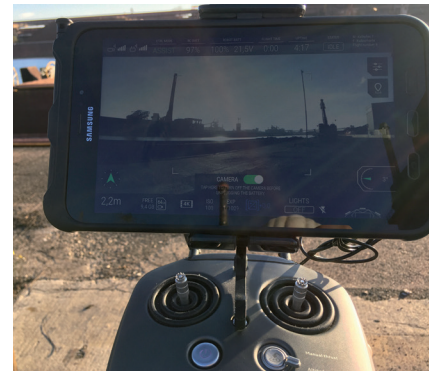
Bedieneinheit der Drohne