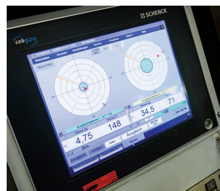
Messgerät CAB 920 (computer aided balancing)