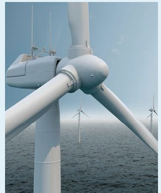
Spezialteile für Wind- und Wasserkraftanlagen