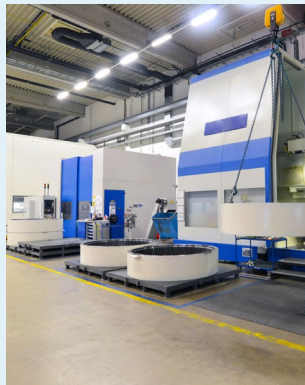
Pressen, Spritzgussmaschinen, Getriebegehäuse