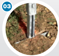
Pose des piquets sur les embases