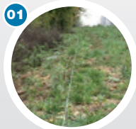
Positionnement du cordon d'alignement

Pour un rendement optimal et un coût de pose maîtrisé