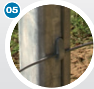
Fermeture des linguets

« Nos équipes vous accompagnent dans la réalisation de vos projets »