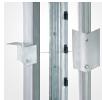
Ankerplatte Endpfahl, Krallenschutz, Ankerplatte Spalierpfahl