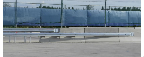
ÜKA201 - 01/2019