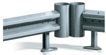
Anprallschutz über Ecken und Kanten

Rammed post for assembly into pile driving ground