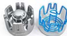
Refroidissement ciblé sur les points chauds