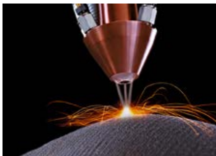
Dépôt par fusion laser