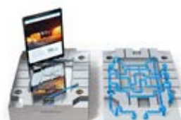
Une production flexible de vos moules