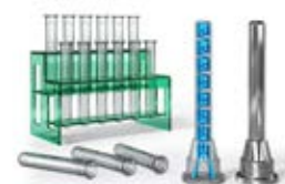
Au-delà des simples lignes droites