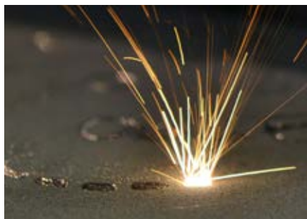
Fusion laser sur lit de poudre

Les Centres d'Excellence utilisent l'équipement provenant des fournisseurs principaux de la Fabrication Additive, aussi bien pour la fusion laser sur lit de poudre que pour le dépôt par fusion laser . En travaillant avec les deux technologies de production, issues de différents fournisseurs, voestalpine possède la flexibilité et l'expertise pour sélectionner le meilleur procédé de production de Fabrication Additive adapté à votre besoin.