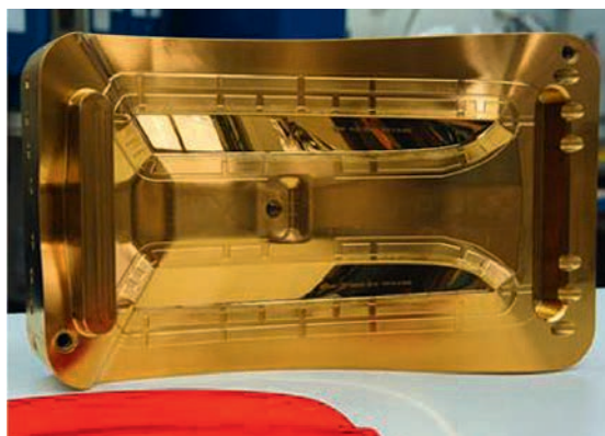
Moule revêtu de TiN-ultrafine pour le moulage par injection de matières plastiques (au 1 er plan le cache plastique fabriqué pour le secteur automobile).

exigences en matière de résistance à l'abrasion sont élevées. Le revêtement TiN-ultrafine lisse et brillant est obtenu grâce à notre technologie SPCS. SPCS signifie «Strongly Poisoned Cathode Surface» et décrit notre procédé spécial de revêtement PVD-Arc avec lequel nous pouvons obtenir des propriétés de revêtement exceptionnelles grâce à un système de contrôle innovant du gaz.