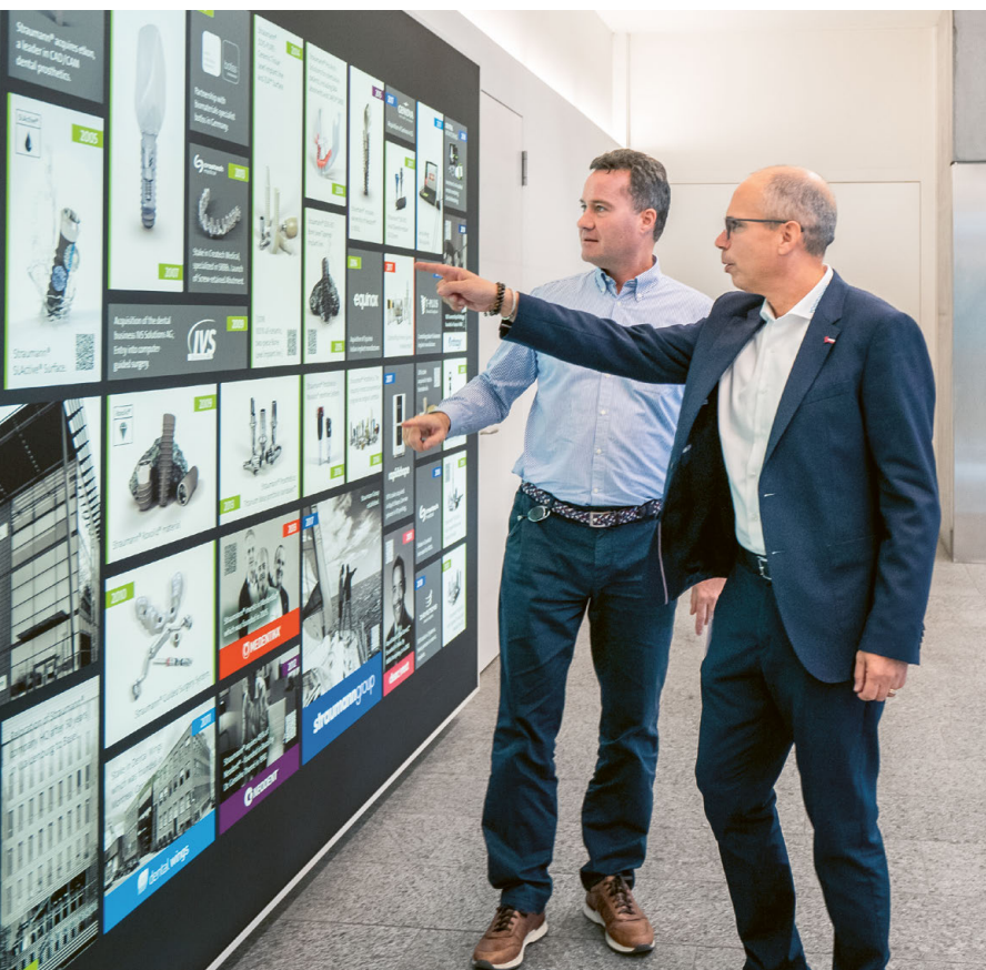
La recette du succès : un développement constant aux côtés d'un partenaire solide.