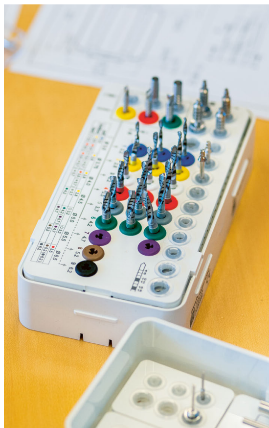
Les implants de Straumann Group répondent aux plus hautes exigences de qualité – et l'acier voestalpine y est pour quelque chose.

mais aussi durables, inoxydables, stérilisables et résistants aux traitements de surface. Les aciers N360 et S390 Microclean de voestalpine répondent à ces exigences. Particulièrement endurants, tous deux résistent aussi à la corrosion et à la compression. « Le matériau que nous livre voestalpine est très performant », témoigne B. Coicadin. Ce n'est pas le fruit du hasard. voestalpine a déjà de nombreuses années d'expérience dans le secteur de la technique médicale et se porte garant de l'ensemble de la chaîne d'approvisionnement, de la fabrication dans ses aciéries à la livraison, en passant par le contrôle qualité, la validation de la qualité et le stockage. Chaque implant de Straumann est marqué, ce qui assure sa traçabilité durant au moins 20 ans – c'est aussi le cas des composants en acier. Le travail de suivi est mené rigoureusement.