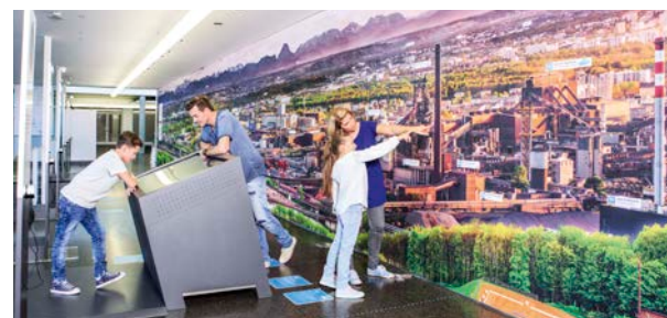
Das 30 Meter lange Panorama des Werks eröffnet ungeahnte Perspektiven.

Sie wollen mehr erleben? Bei der 90-minütigen Werkstour entdecken Sie das über 5 km 2 große Werksgelände der voestalpine: Kommen Sie gemeinsam mit unseren Guides der Arbeitswelt am Hochofen, im Warmwalzwerk und bei Automotive Components hautnah auf die Spur!