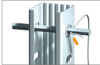
Fűzze be a huzalokat.